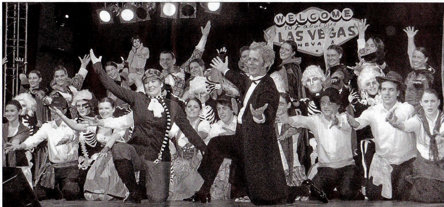
Mit einem Gänsehaut-Finale klang am Freitagabend in der Rottweiler Stadthalle die Show »Feet-e-motion« aus.